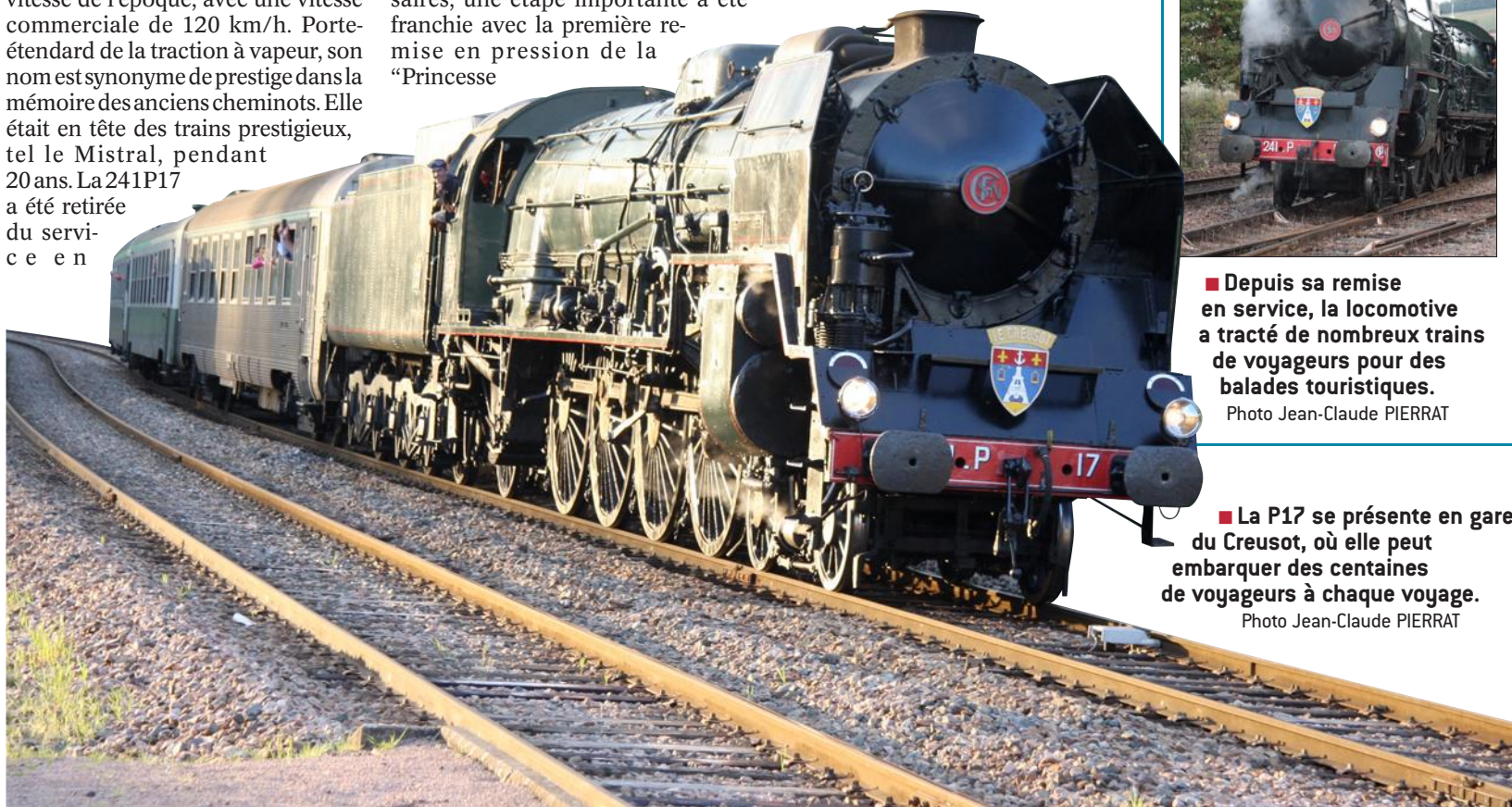
■ La P17 se présente en gare du Creusot, où elle peut embarquer des centaines de voyageurs à chaque voyage.