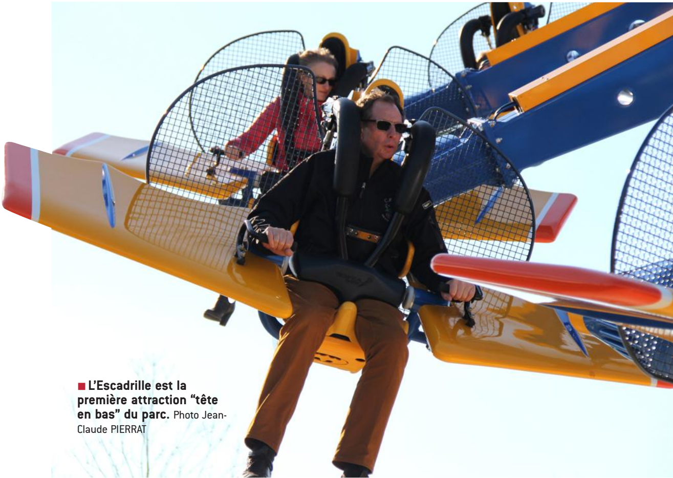
■ L'Escadrille est la première attraction "tête en bas" du parc.

Un an après la mise en service des Montgolfières installées au printemps 2013 à l'entrée du parc et trois années après le Boomerang, l'association des Chemins de fer du Creusot a engagé de nouveaux travaux d'engergure. La 11 e attraction du parc des Combes s'appelle l'Escadrille. C'est un investissement de 500 000 € que l'association a assuré pour la faire sortir de terre. Elle a été installée à proximité du Boomerang, sur les hauteurs du parc. Elle procure autant de sensations que celui-ci, avec en plus une interactivité avec le public.