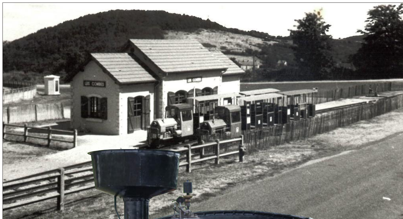
■ Les locotracteurs ont servi à aménager les voies, qui provenaient du site industriel de Creusot Loire.

“ On était une trentaine de bénévoles tous les jours sur le chantier. C’était pour la plupart des retraités de l’usine Creusot Loire, tous passionnés. ”