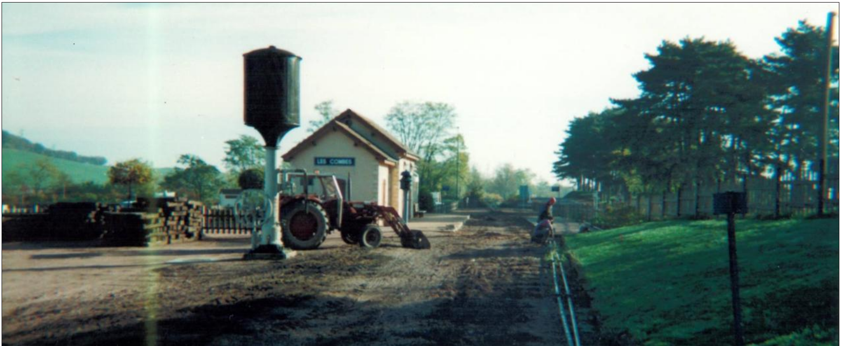
■ Le site des Combes a commencé à se transformer à partir de 1985. La gare y était en bonne place.