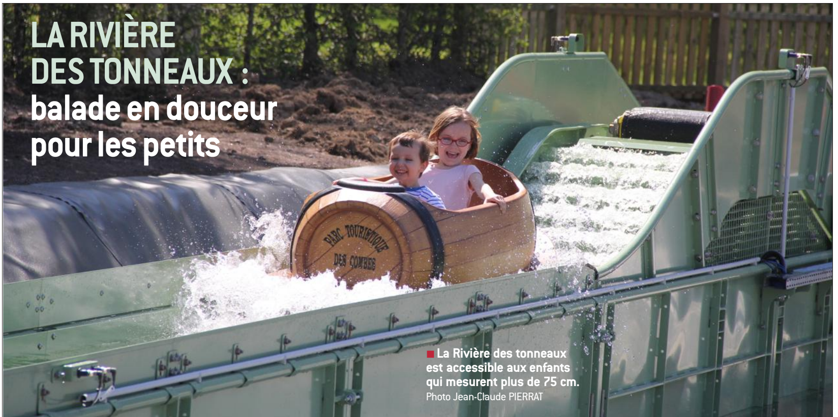
■ La Rivière des tonneaux est accessible aux enfants qui mesurent plus de 75 cm.

En 2015, les responsables creusotins ont décidé d'augmenter l'attractivité du parc des Combes. Ils ont prévu un nouveau programme d'investissement. 300 000 € tournés en direction des jeunes enfants (à partir de