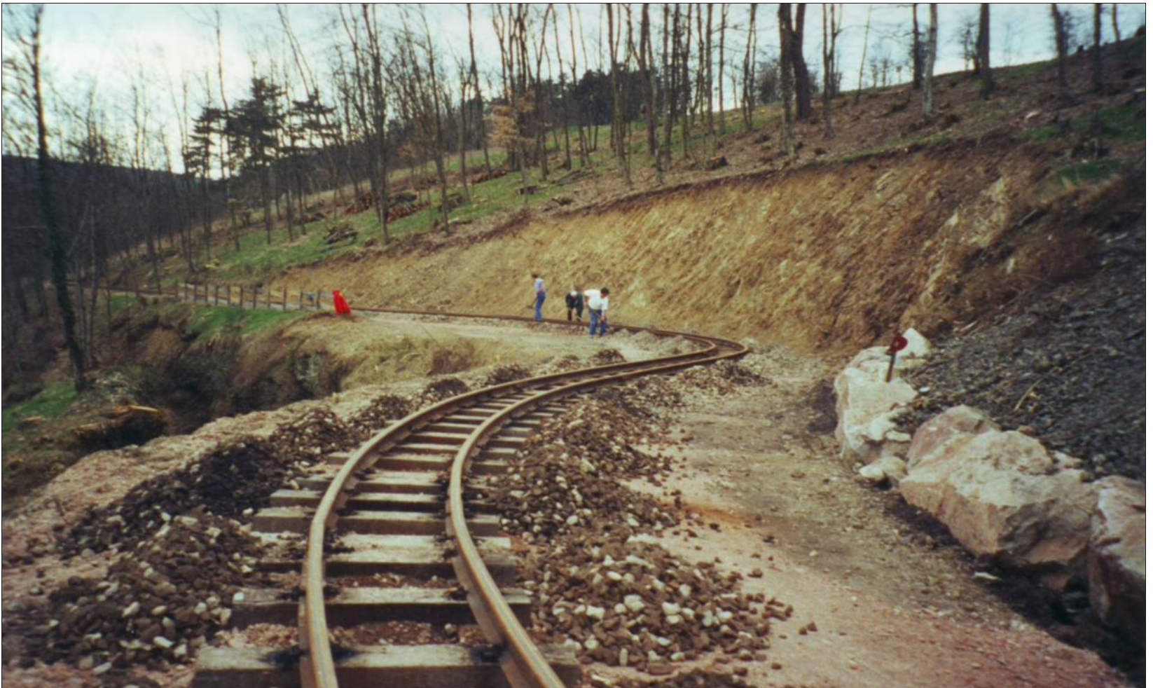
■ Il a fallu plus de dix ans aux passionnés de modélisme, notamment des retraités de Creusot Loire, pour poser les voies sur le site des Combes.