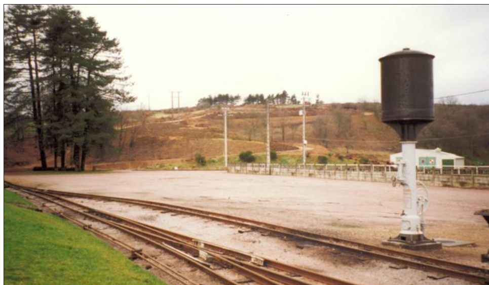
■ L'esplanade du parc des Combes avant l'installation des premières attractions.