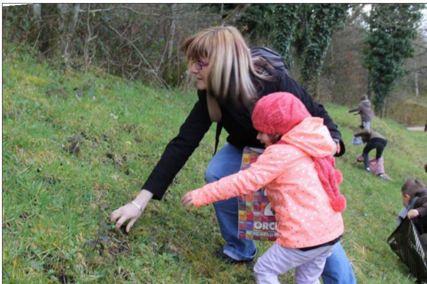
■ Le train des œufs de Pâques permet aux enfants d'aller à la recherche des fameuses friandises.