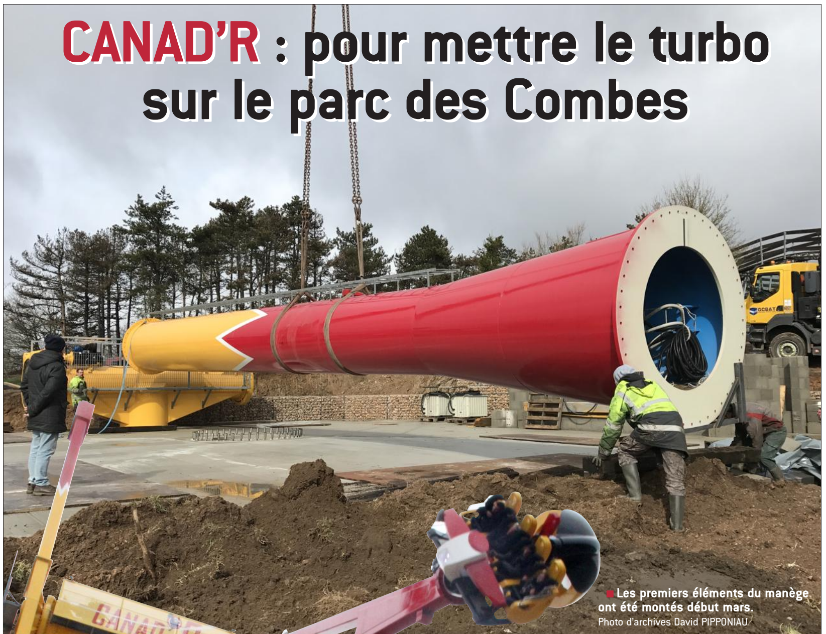
■ Les premiers éléments du manège ont été montés début mars.

■ Le bras du manège vous élève à près de 40 m de hauteur... à 100 km/h.