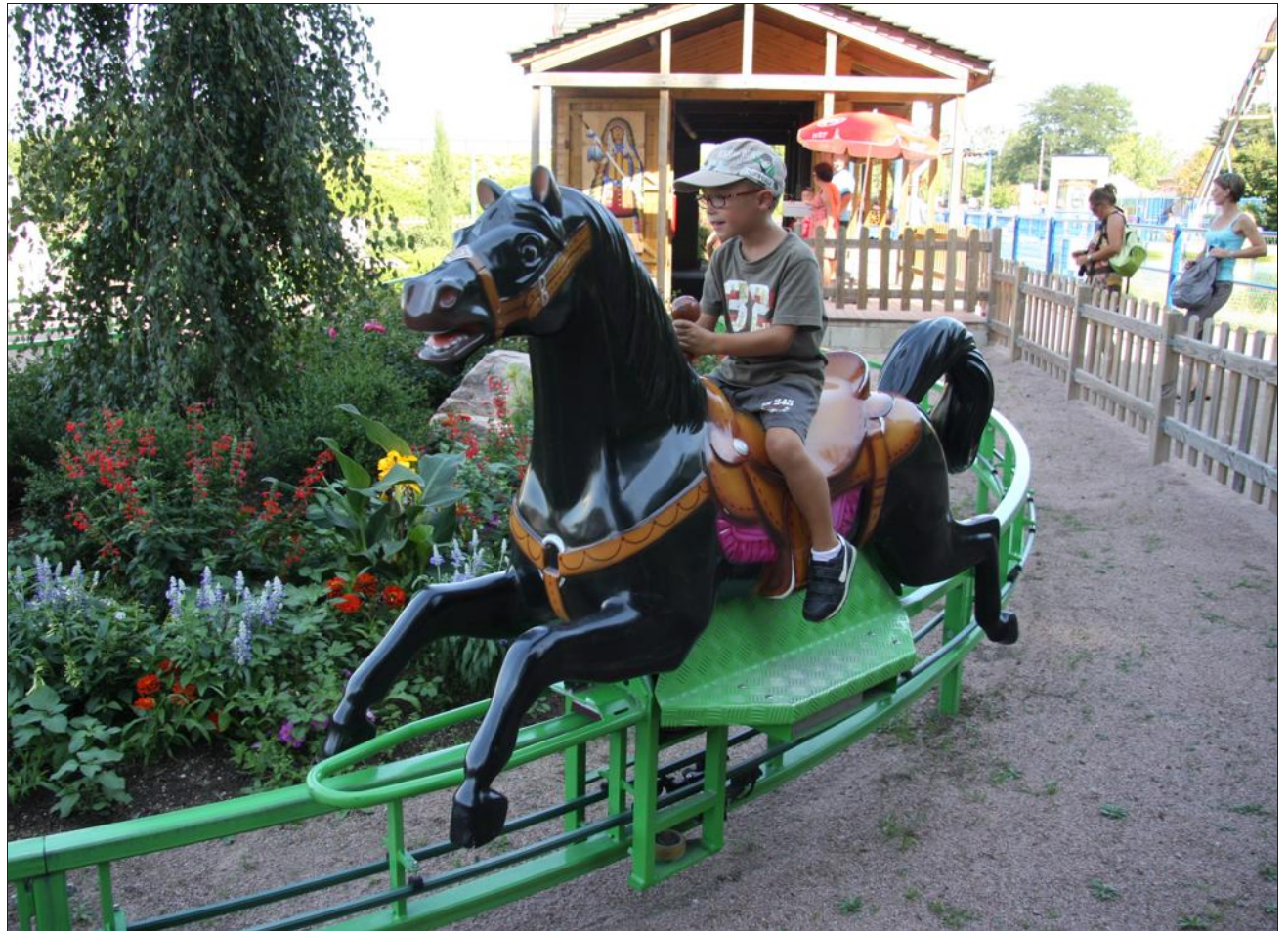
■ Les chevaux traversent de nombreux décors sur plusieurs centaines de mètres.

Depuis 2009, l'attraction offre aux enfants la possibilité de se détendre avant de retourner sur des attractions à sensations bien plus fortes. Les plus jeunes apprécient particulièrement cette attraction douce. Elle est ouverte aux enfants qui mesurent moins de 1 m s'ils sont accompagnés.