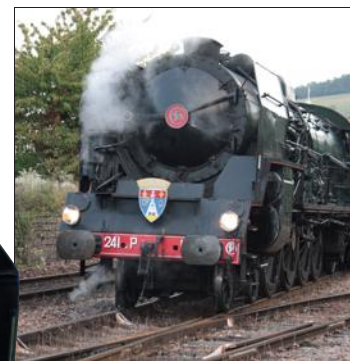
■ Depuis sa remise en service, la locomotive a tracté de nombreux trains de voyageurs pour des balades touristiques.