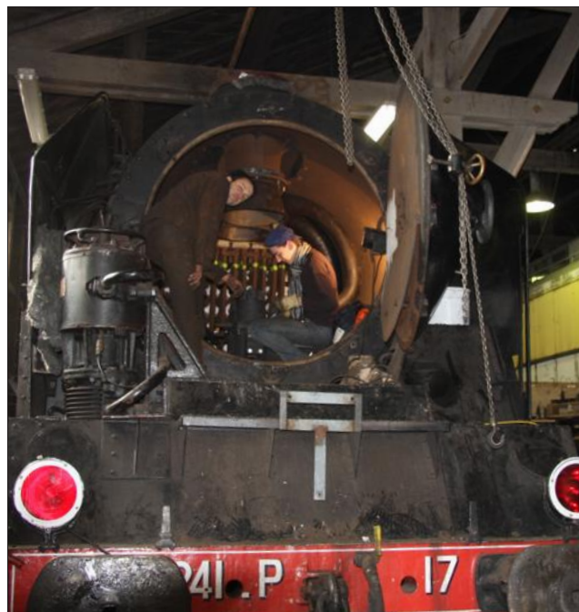
■ La rénovation de la machine a demandé treize années de travail.

L'association Les Chemins de fer du Creusot a remis en route une locomotive à vapeur datant de 1949. Elle propose aujourd'hui des balades touristiques.