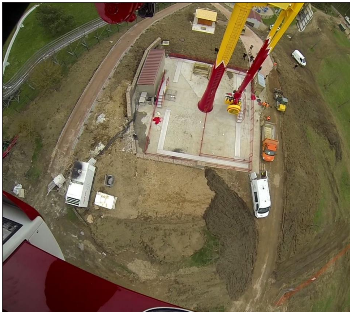
■ Depuis le Canad'R, la vue est imprenable sur le parc, Le Creusot et la vallée du Mesvrin.

Immersion dans le Canad'R sur le site du JSL : http://www.lejsl.com/edition-le-creusot/2017/03/22/on