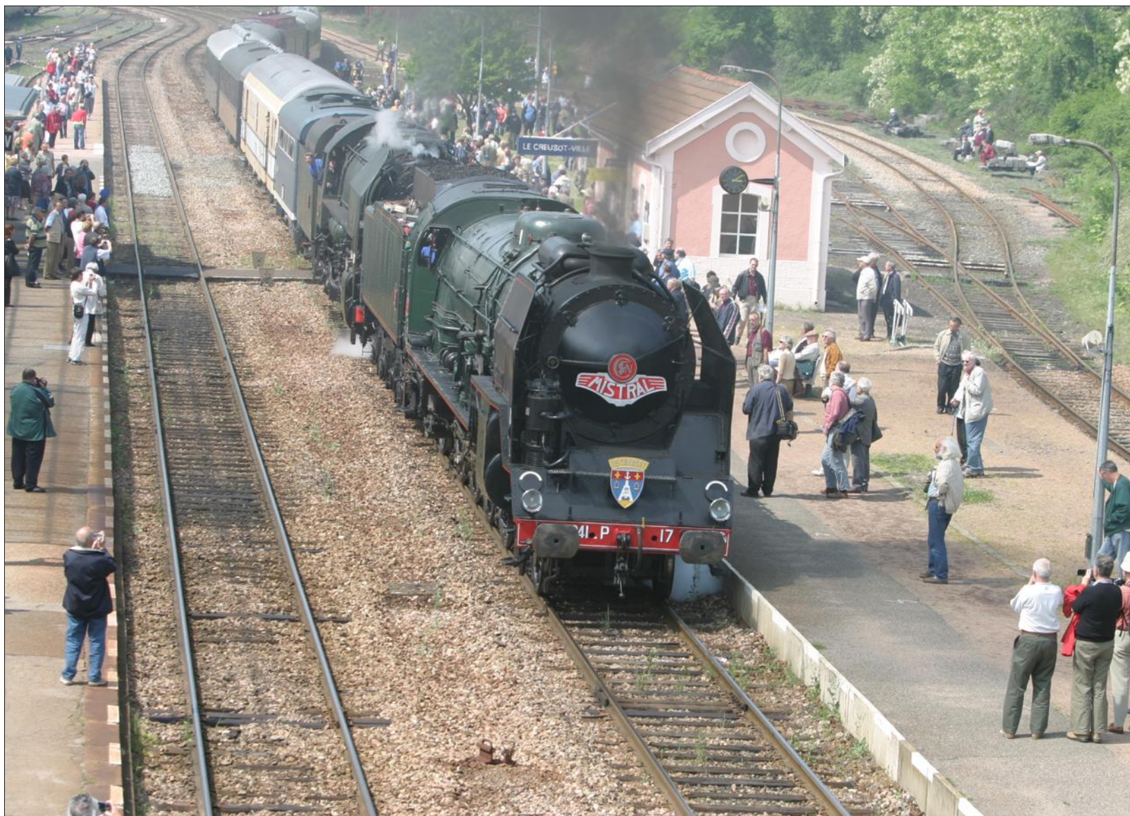
■ La locomotive à vapeur du Creusot sera la vedette des six voyages organisés en 2017.

Un voyage exceptionnel est prévu à Apremont-sur-Allier, avec la locomotive à vapeur P17. Les participants visiteront le château de la famille Schneider.