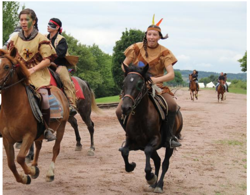
■ La fête de l'Amérique, avec l'attaque des trains par les Indiens, reste un moment fort de la saison.