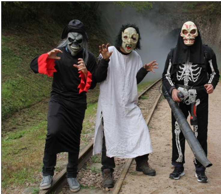
■ Halloween ne se démode pas au parc des Combes et chaque année, le public est au rendez-vous.