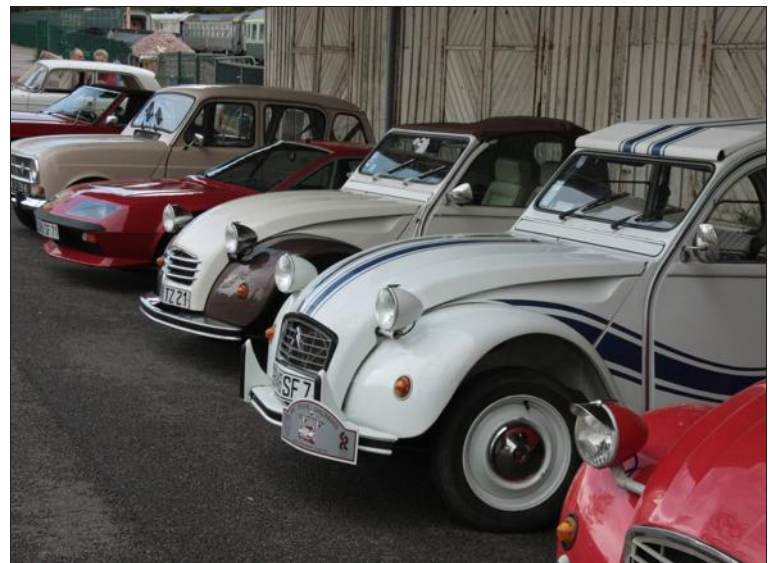
■ Le rassemblement de vieilles voitures aura lieu à la Pentecôte.