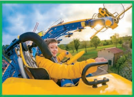
ESCADRILLE (DÈS 1,30 M)