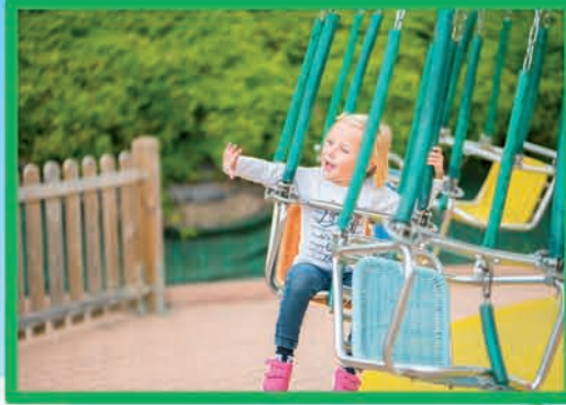
PETITES CHAISES VOLANTES (DÈS 90 CM, MAX 1,40 M)