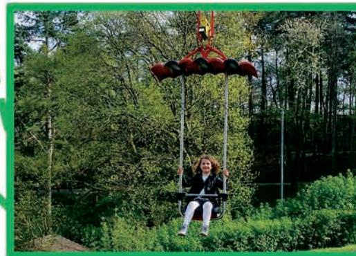
TYROLIENNE (DÈS 7 ANS ET 1,25 M)