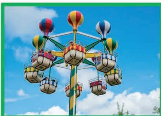
MONT GOLFIERES (MOINS DE 1,20 M ACCOMPAGNÉ)