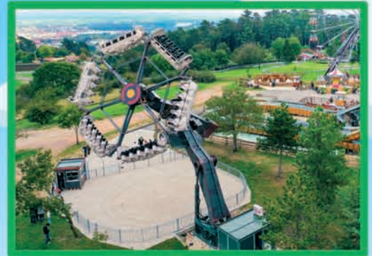
ODYSSEUS (DÈS 1,40 M)