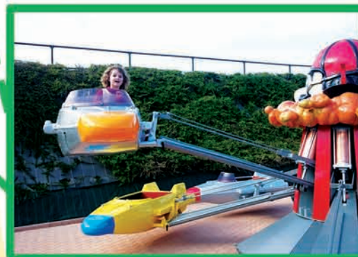
AÉROPLANES (DÈS 75 CM MOINS DE 90 CM ACCOMPAGNÉ)