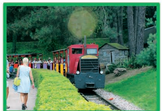
TRAIN TOURISTIQUE (MOINS DE 12 ANS ACCOMPAGNÉ)