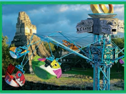
NOUVEAUTÉ 2023 : LES TOUCANS (DÈS 90 CM MOINS DE 1,10 M ACCOMPAGNÉ)