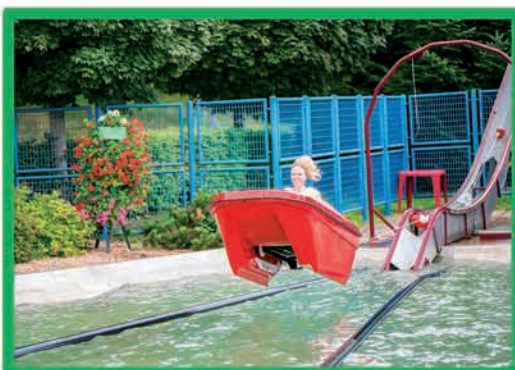
NAUTIC JET (DÈS 7 ANS ET 1,25 M)