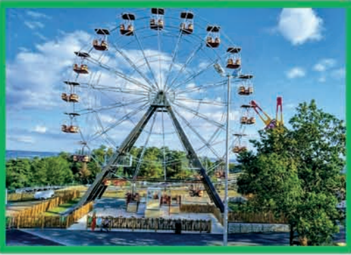
GRANDE ROUE (MOINS DE 1,40 M ACCOMPAGNÉ)