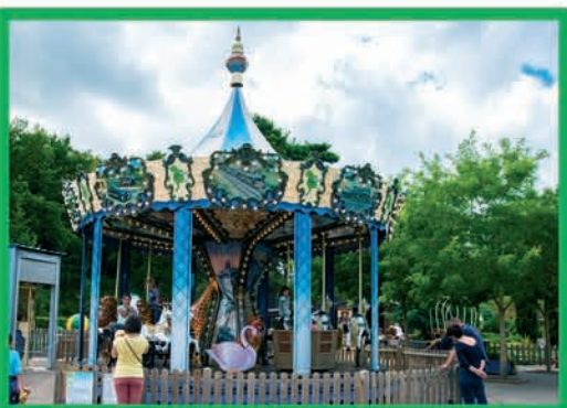
CARROUSEL (DÈS 1 AN MOINS DE 90 CM ACCOMPAGNÉ)