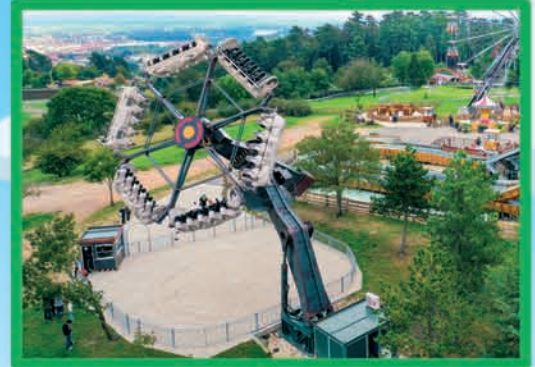
ODYSSEUS (DÈS 1,40 M)