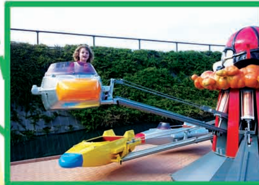
AÉROPLANS (DÈS 75 CM MOINS DE 90CM ACCOMPAGNÉ)