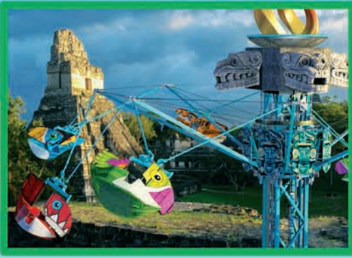
LES TOUCANS (DÈS 90 CM MOINS DE 1,40 M ACCOMPAGNÉ)