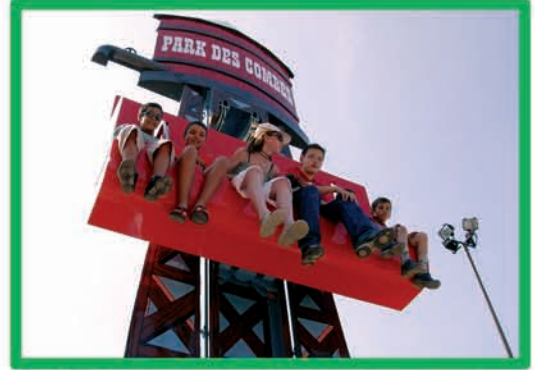
VERTINGO (DÈS 90 CM MOINS DE 1 M ACCOMPAGNÉ)