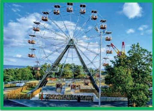
GRANDE ROUE (MOINS DE 1,40 M ACCOMPAGNÉ)