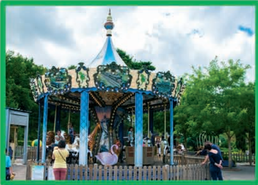
CARROUSEL (DÈS 1 AN MOINS DE 90 CM ACCOMPAGNÉ)