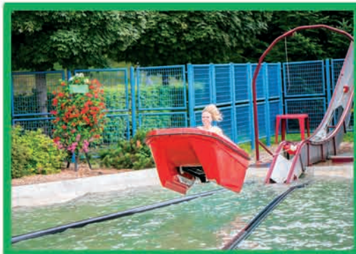
NAUTIC JET (DÈS 7 ANS ET 1,25 M)