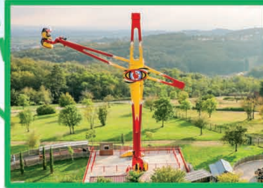
CANAD'R (DÈS 1,40 M MOINS DE 14 ANS ACCOMPAGNÉ)