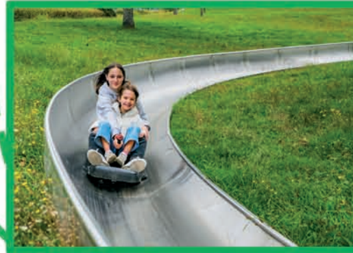
LUGE D'ÉTÉ (DÈS 3 ANS MOINS DE 8 ANS ACCOMPAGNÉ)