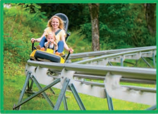
ALPINE COASTER (DÈS 3 ANS MOINS DE 8 ANS ACCOMPAGNÉ)