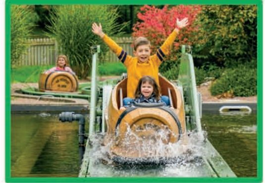
RIVIÈRE DES TONNEAUX (DÈS 90 CM MAXI 1,40 M)