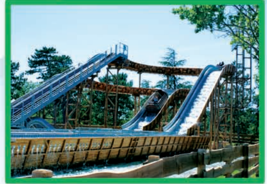
RIVIÈRES DE L'OUEST (DÈS 1 M MOINS DE 1,40 M ACCOMPAGNÉ)