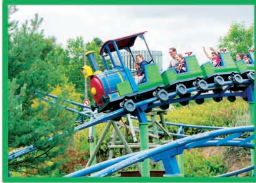
DEVAL'TRAIN (DÈS 1 M, MOINS DE 1,20 M ACCOMPAGNÉ)