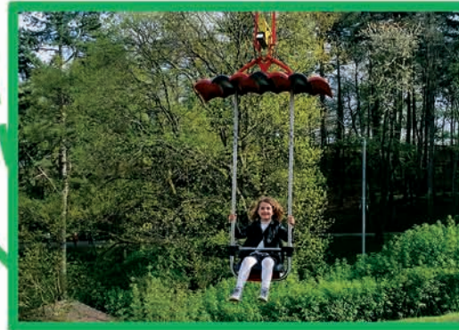
TYROLIENNE (DÈS 7 ANS ET 1,25 M)