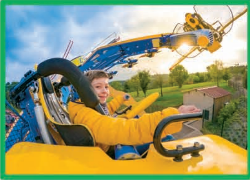
ESCADRILLE (DÈS 1,30 M)