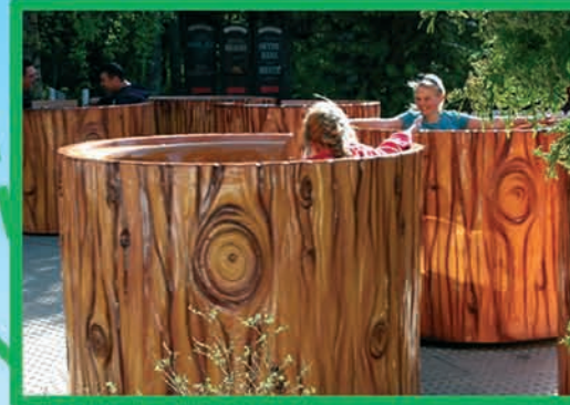
LA RONDE DES ÉCUREUILS (DÈS 80 CM MOINS DE 1,10 M ACCOMPAGNÉ)