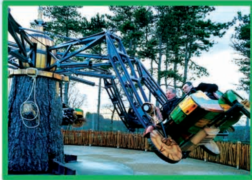
WOODSIDE 66 (DÈS 90 CM, MOINS DE 1,30 M ACCOMPAGNÉ)