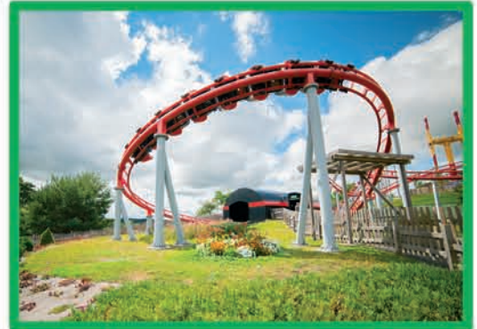
BOOMERANG (DÈS 1 M MOINS DE 1,20 M ACCOMPAGNÉ)